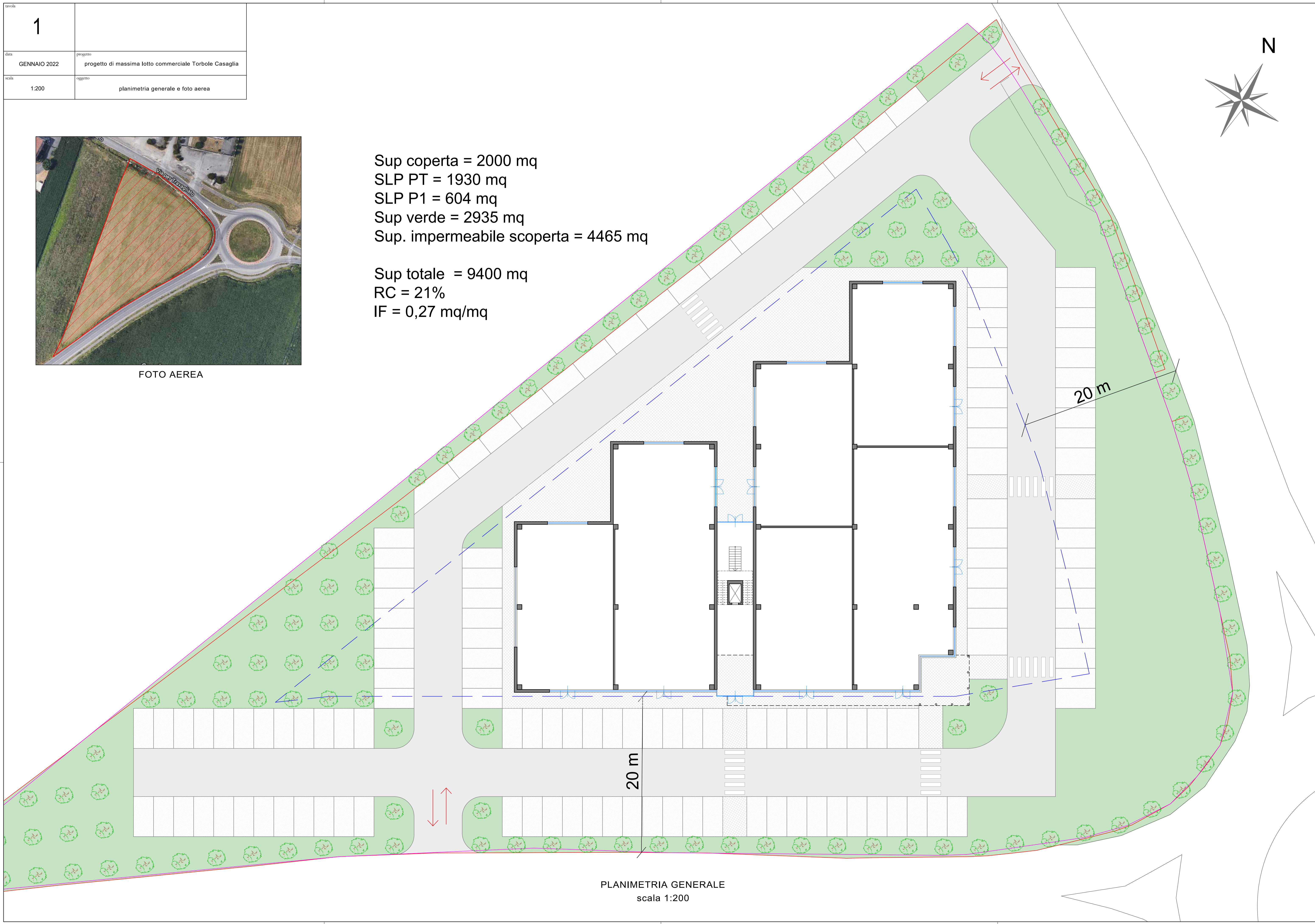
PLANIMETRIA GENERALE scala 1:200